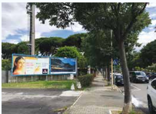
Pag. 4-5 La campagna pubblicitaria 2018

miglioramento di un servizio, necessità che prende le mosse sempre e comunque dalla nostra osservazione e dalla nostra esperienza sul campo.