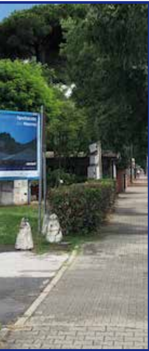
na annuale che ha utilizzato