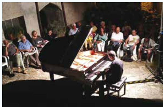
Pag. 8 Eventi dell’estate spezzina