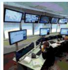
Centrale Operativa h24

La Lince, 60 anni di sicurezza di alta affidabilità