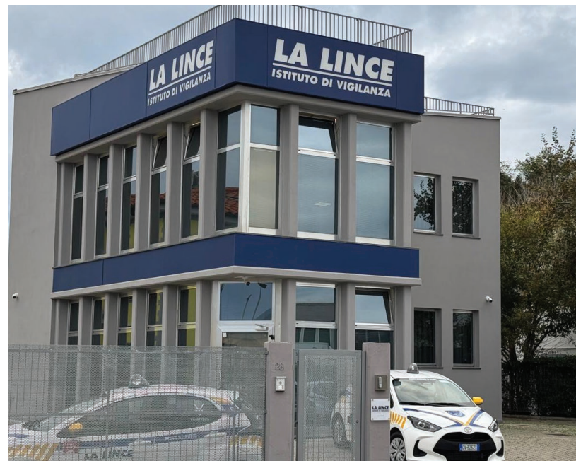
LA FILIALE DI LIVORNO DELL'ISTITUTO DI VIGILANZA LA LINCE

La Lince offre progetti di sicurezza sempre personalizzati. Affinché un servizio di sicurezza sia realmente efficace è infatti necessaria l'elaborazione di un piano su misura per il cliente, dal momento che ogni sito ha caratteristiche diverse e peculiari. Per questo non è possibile proporre la stessa soluzione a tutti, ma si effettua un'accurata analisi per stabilire ciò che si vuole proteggere e quali siano il livello di sicurezza e il livello di rischio. La prima fase dello sviluppo di un progetto di sicurezza è pertanto il sopralluogo di un esperto che valuta la situazione e fornisce consulenza sulle soluzioni più adeguate.